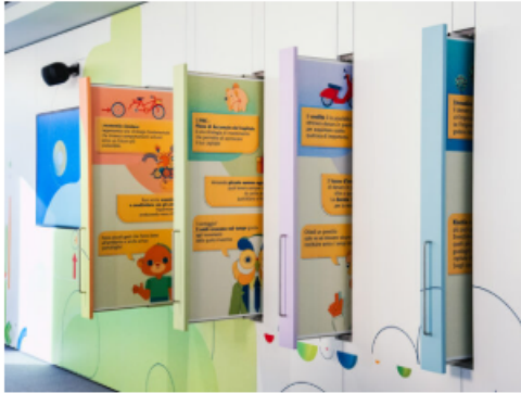
Gli studenti scoprono l'educazione finanziaria attraverso le installazioni interattive del museo MiFormo

MiFormo rappresenta una rivoluzione nel modo di apprendere l'alfabetizzazione finanziaria. Il museo interattivo non si limita alla tradizionale esposizione didattica, ma coinvolge i visitatori attraverso giochi, installazioni multimediali e soluzioni tecnologiche avanzate che rendono ogni visita un percorso sorprendente.